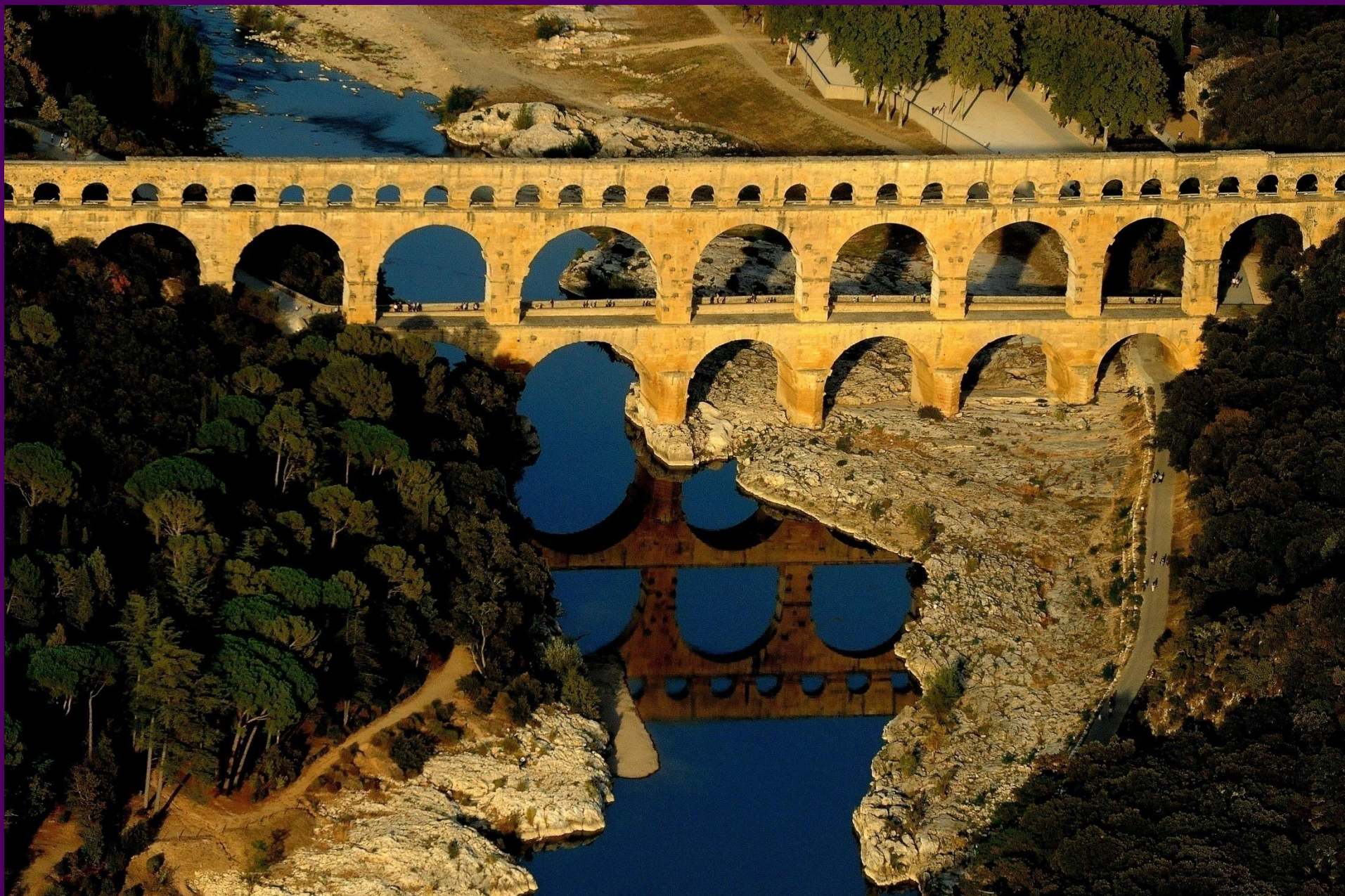
Le Pont du Gard