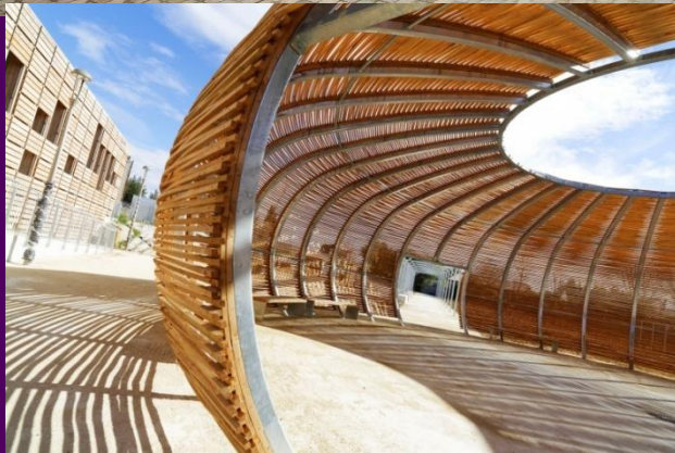
Dégustation de vin