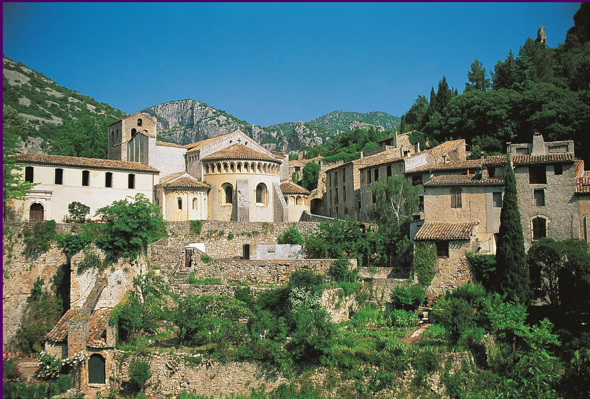
St Guilhem le Désert, St Jacques de Compostelle