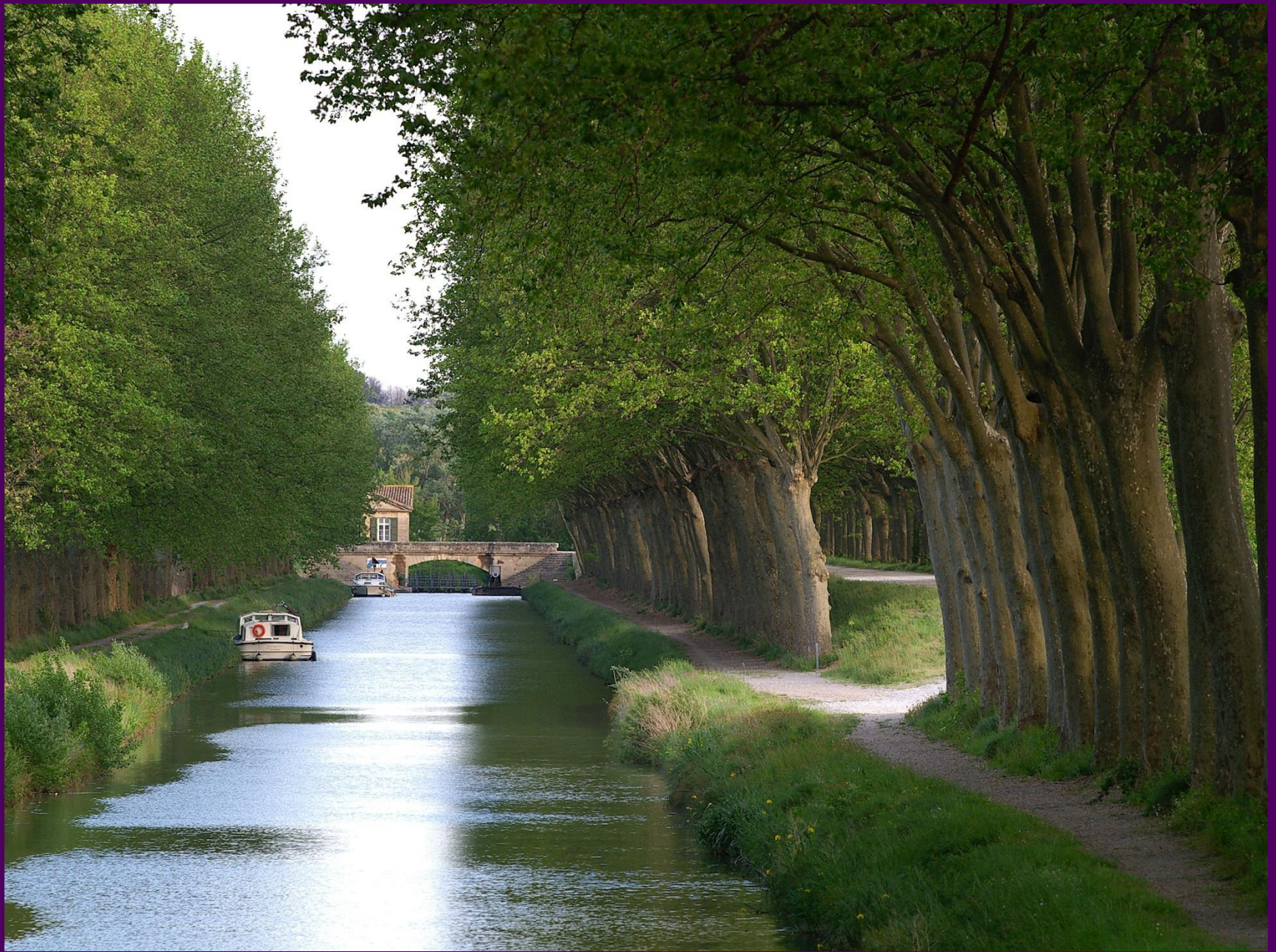
Le Canal du Midi