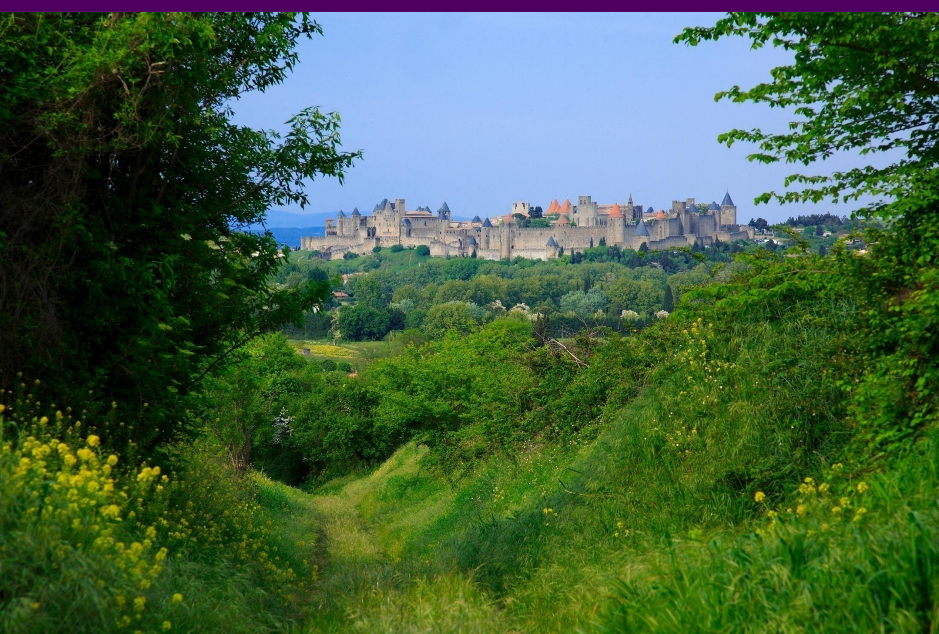
La cité médiévale de Carcassonne