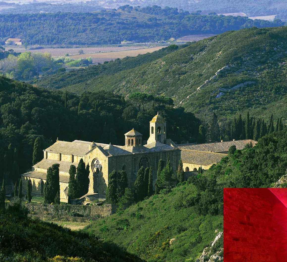
Abbaye de Fontfroide à Narbonne