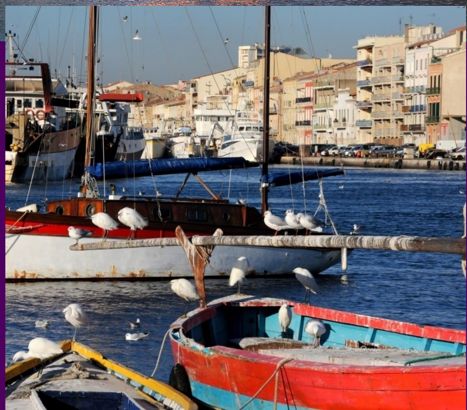
Sète & étang de Thau