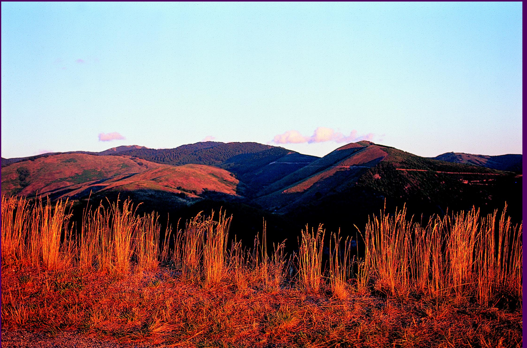
Parc national des Causses et Cévennes