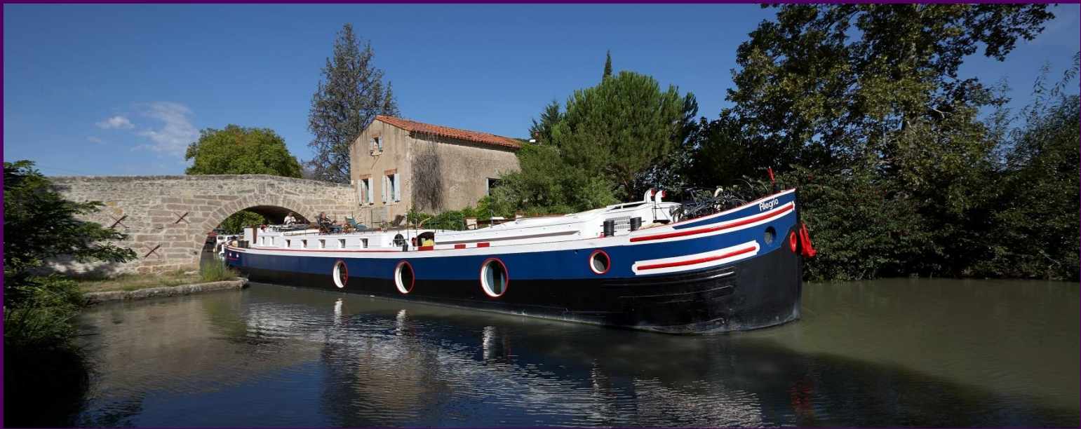
Péniches sur le Canal du Midi