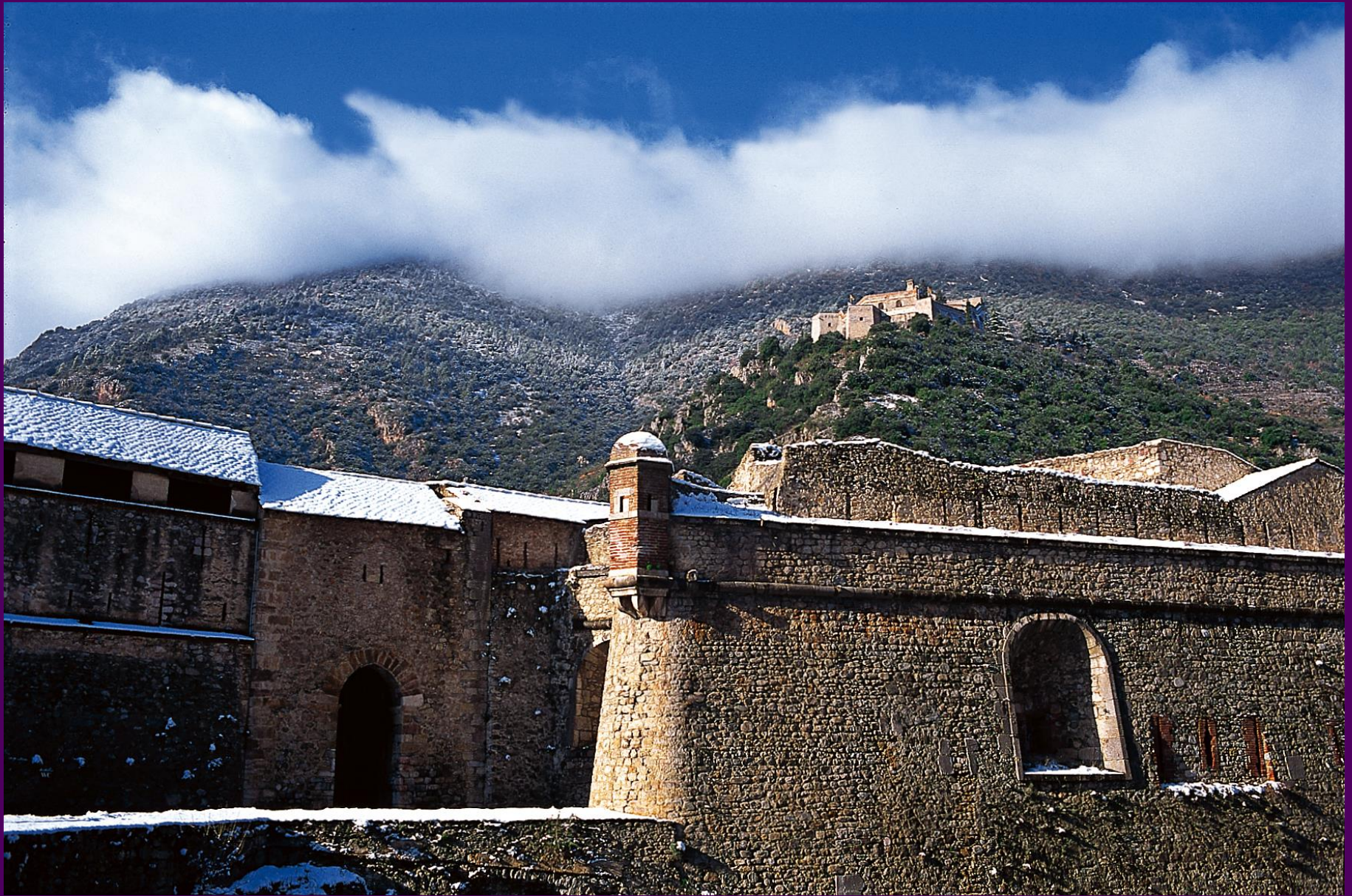
Villefranche de Conflent, forteresse de Vauban