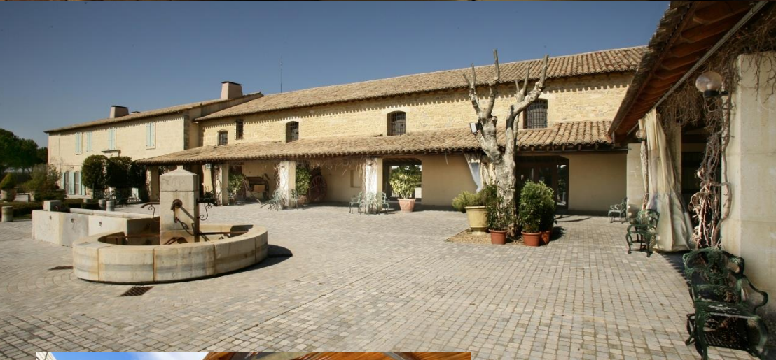
« Manade » ou domaines camarguais