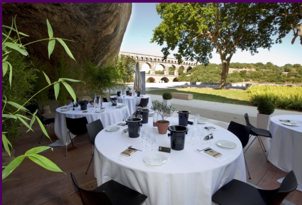
Le Pont du Gard